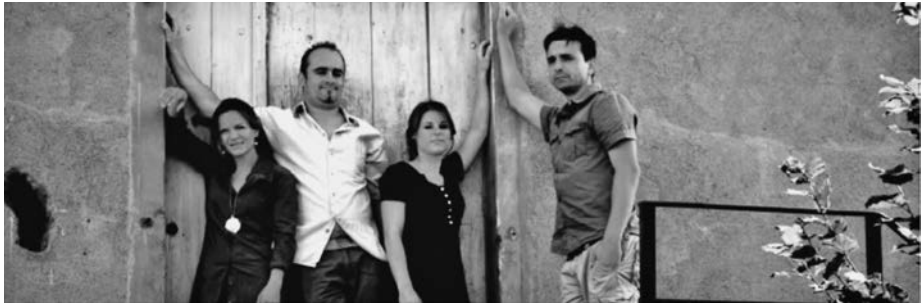
Sime Vigu Ise Nik